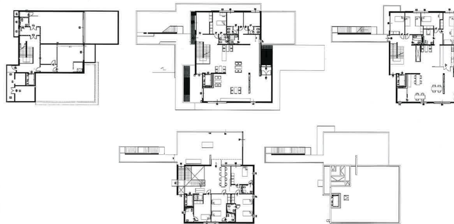
Viste esterne, Piante della struttura.

chiedono assistenza continua. Il luogo prescelto per l'intervento è il lotto sui cui insiste la vecchia Latteria, simbolo di memoria storica e riferimento per Cusignacco, ma potremmo dire icona di tutti i piccoli paesi che costellano il territorio italiano, in questo